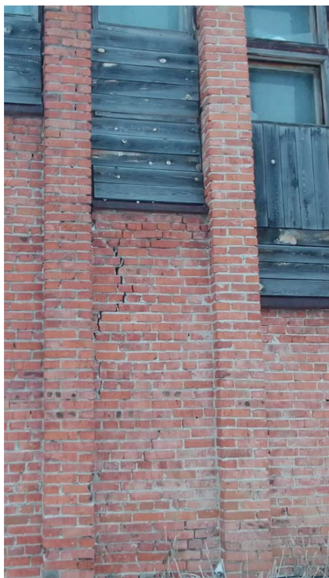
Фото 1.7 Вертикальная трещина в кирпичной стене длиной до 2 м и шириной раскрытия более 5мм