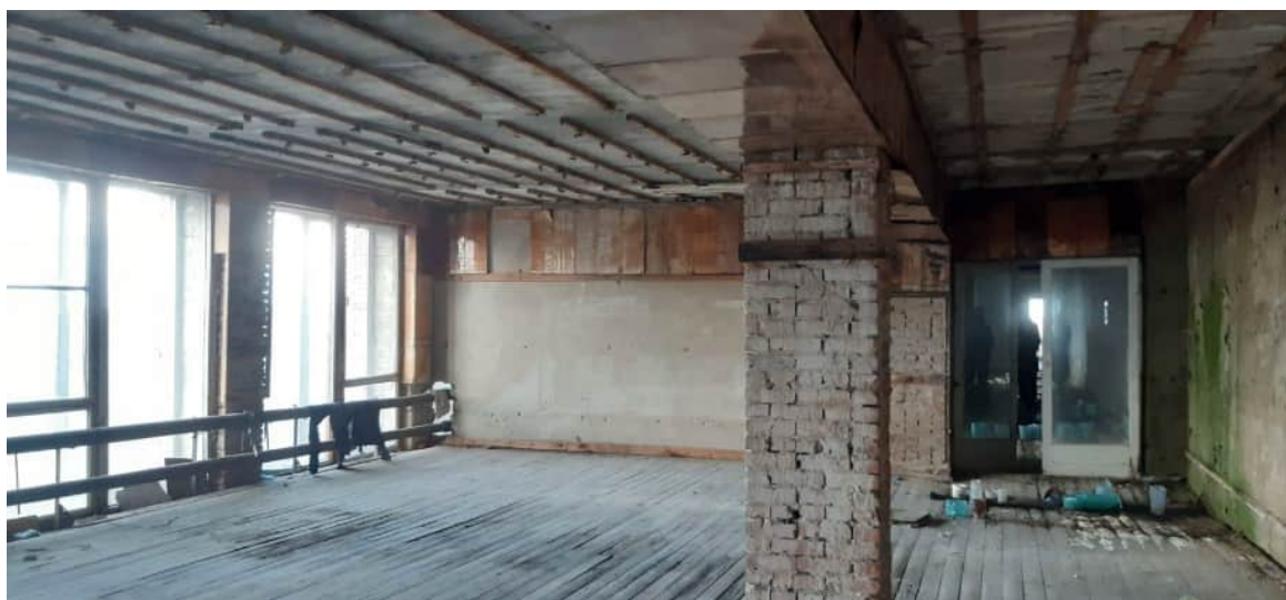
Фото 1.11 Вымывание раствора из швов кирпичной кладки на глубину до 70мм