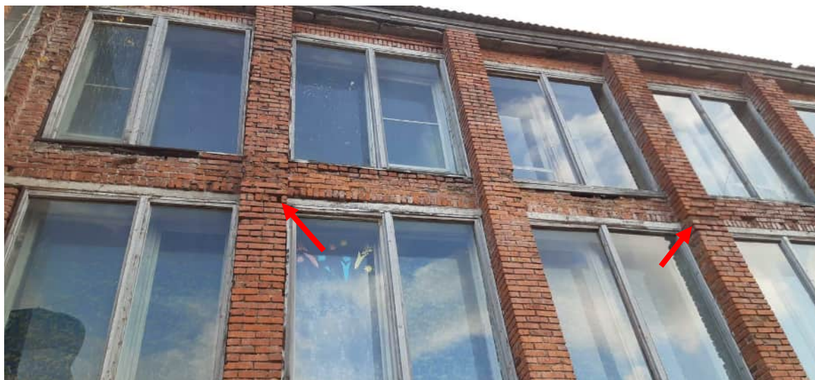
Фото 1.6 Разрушение места опирания железобетонной перемычки на кирпичную стену