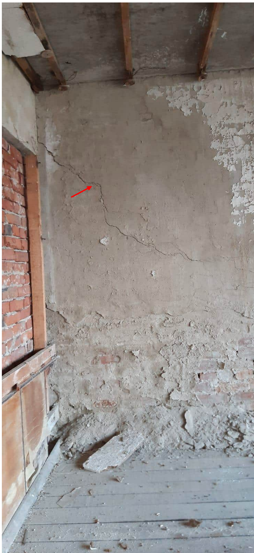
Фото 1.9 Наклонная трещина в кирпичной стене длиной менее 3м и шириной раскрытия менее 5мм