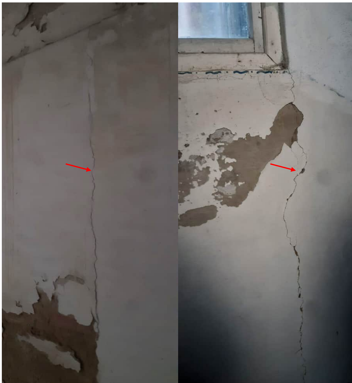
Фото 1.10 Трещина в кирпичной стене длиной до 2м и шириной раскрытия до 8мм