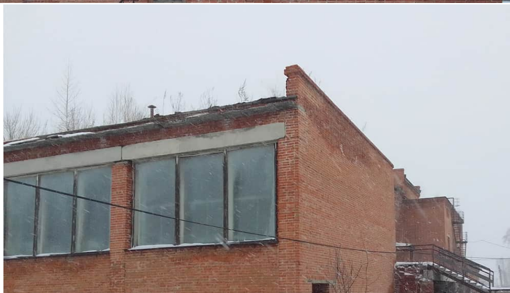
Фото 1.20 Проращение конструкций кровли растительностью