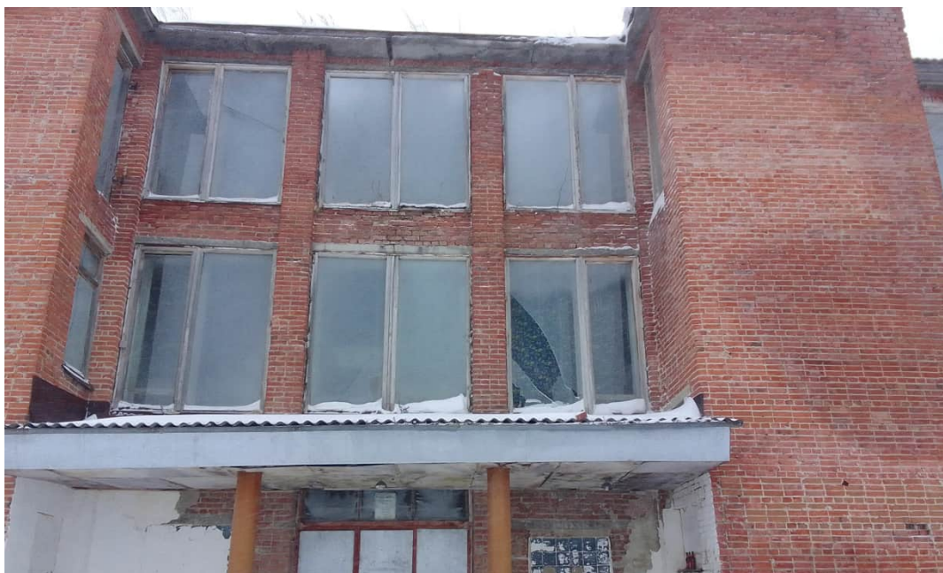
Фото 1.23 Нарушенное остекление и целостность оконных проемов