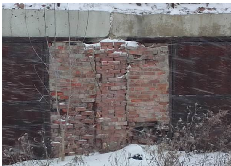
Фото 1.3 Разрушение наружной версты кирпичной кладки на глубину более 100мм