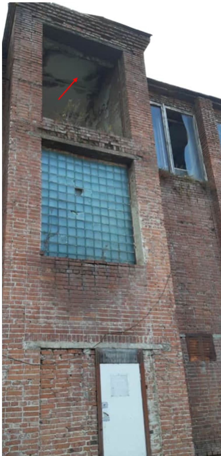
Фото 1.17 Прогиб железобетонных многопустотных плит в середине пролета до 30мм без образования поперечных трещин