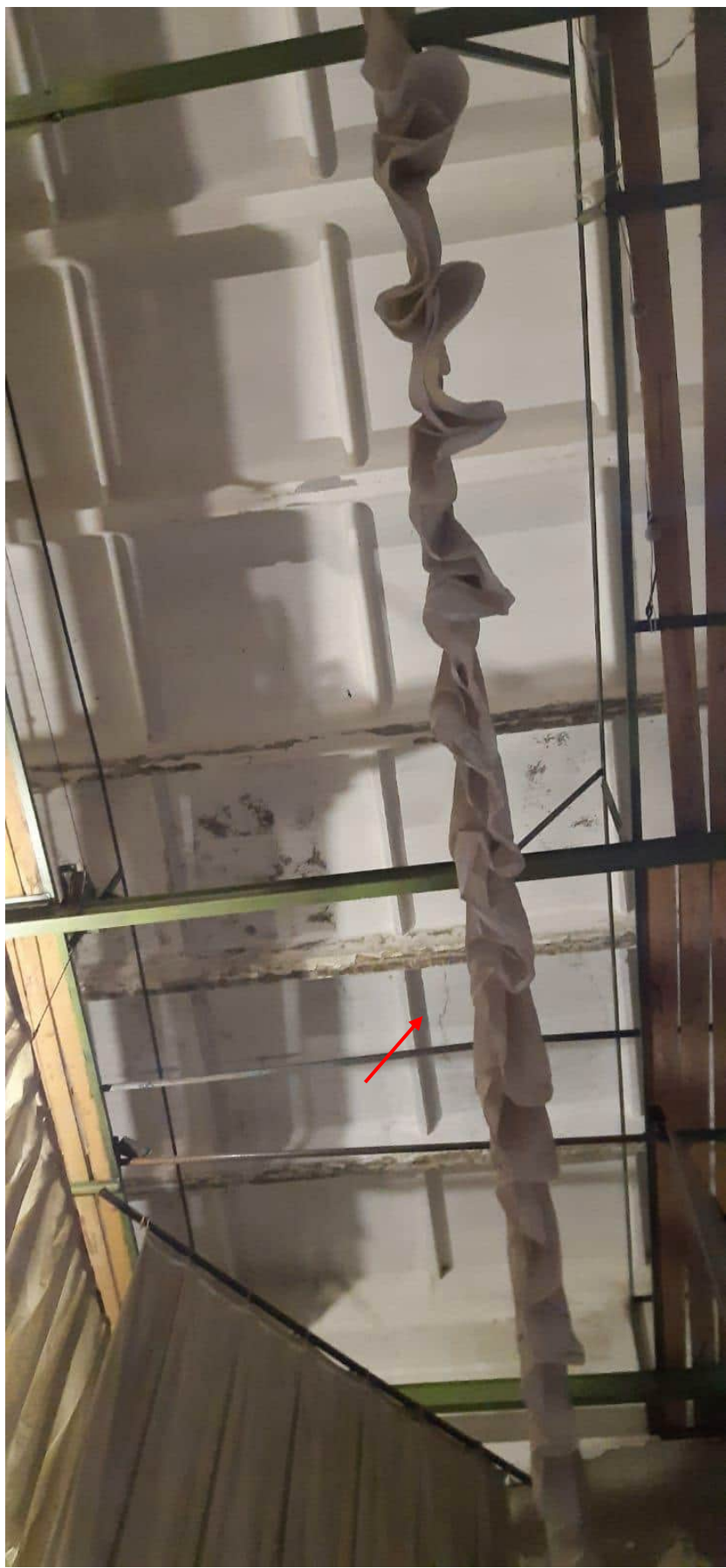
Фото 1.16 Наклонные поперечные трещины в середине пролета продольных ребер с раскрытием до 3мм, разрушение поперечных ребер в местах соединения с продольными ребрами