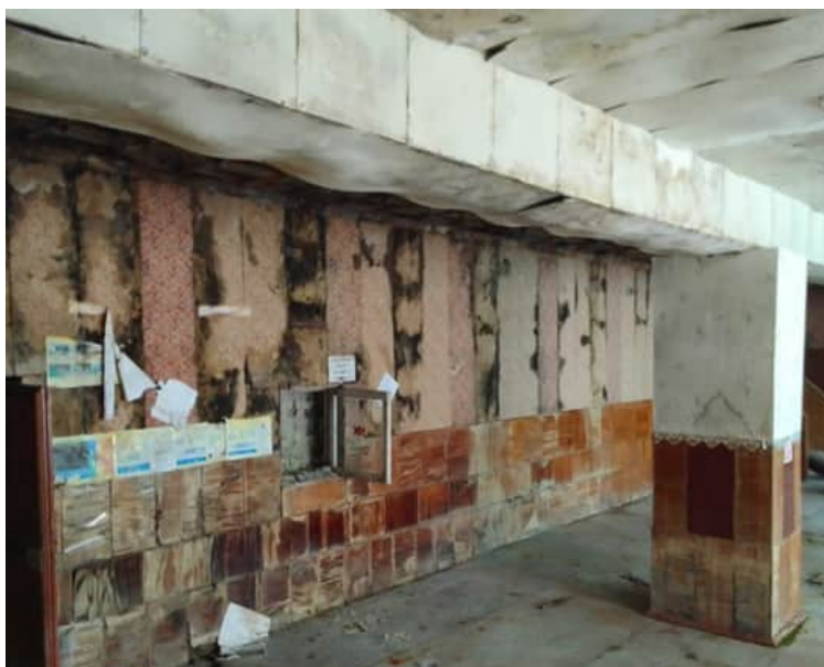
Фото 1.14, 1.15 Замачивание плит, высолы, разрушение штукатурного и покрасочного слоя