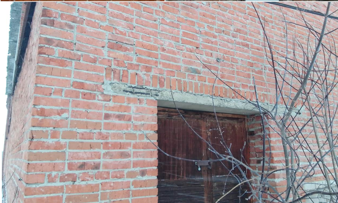
Фото 1.4,1.5 Разрушение защитного слоя бетона железобетонных перемычек, оголение и поверхностная коррозия рабочей арматуры