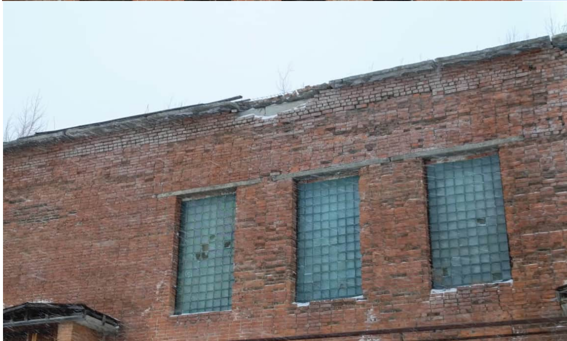
Фото 1.21 Вымывание цементного раствора, разрушение карнизов