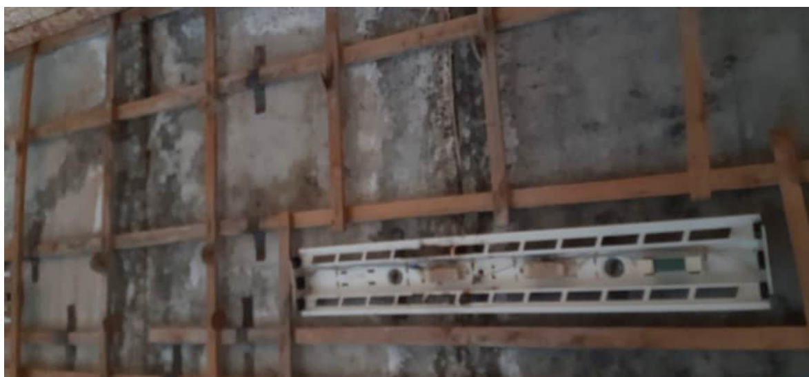
Фото 1.19 Замачивание плит перекрытия, высолы, коррозия рабочей арматуры с уменьшением площади сечения арматуры до 50%