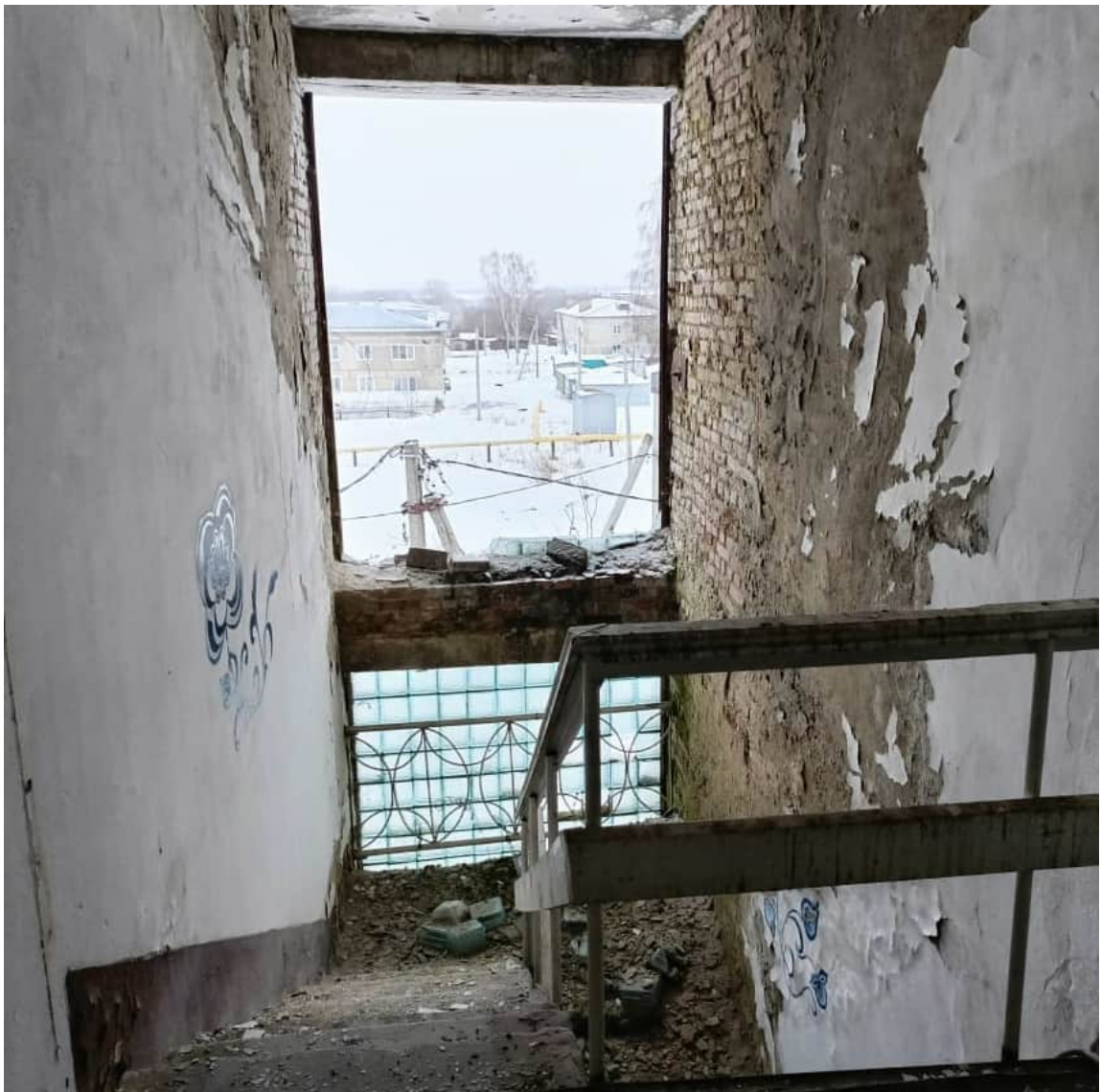
Фото 1.22 Разрушение витражного проема из стеклоблоков