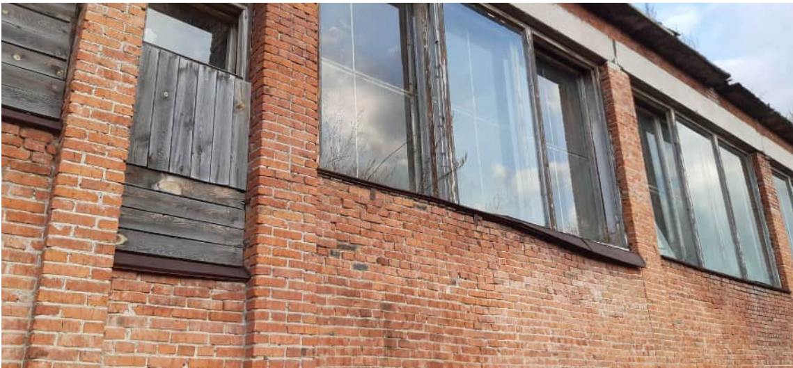
Фото 1.1 Вымывание (выветривание) раствора из швов кирпичной кладки на глубину до 100мм