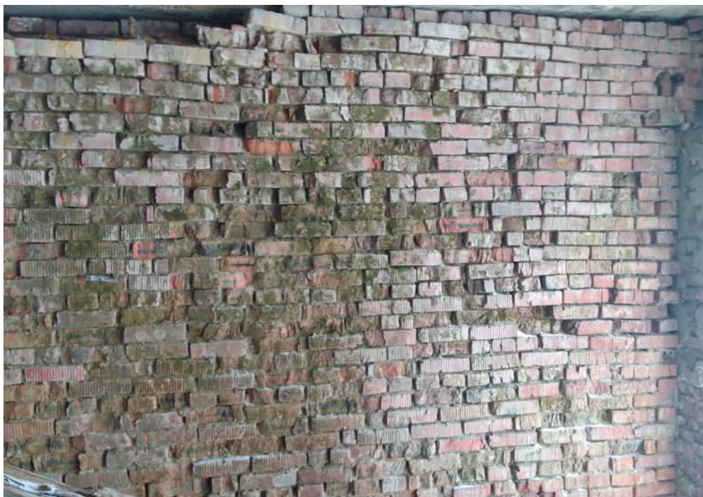
Фото 1.2 Разрушение наружной версты кирпичной кладки на глубину до 100мм