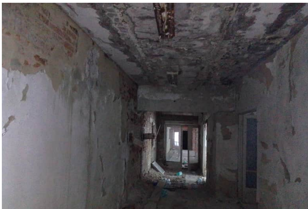
Фото 1.18 Замачивание плит перекрытия первого этажа, высолы