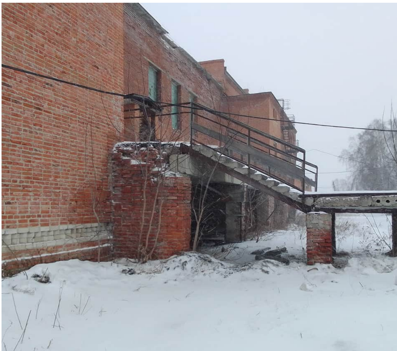
Фото 1.24 Частично разрушены опорные конструкции и ступени наружной лестницы