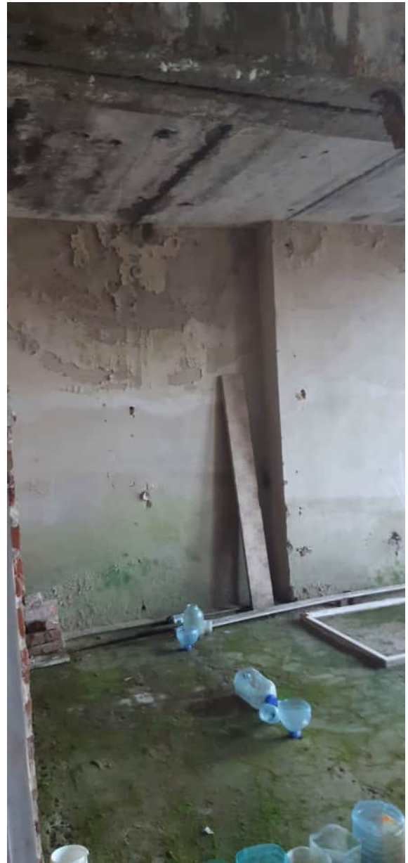
Фото 1.12 Замачивание стен, разрушение штукатурного слоя, образование грибков и плесени на поверхности