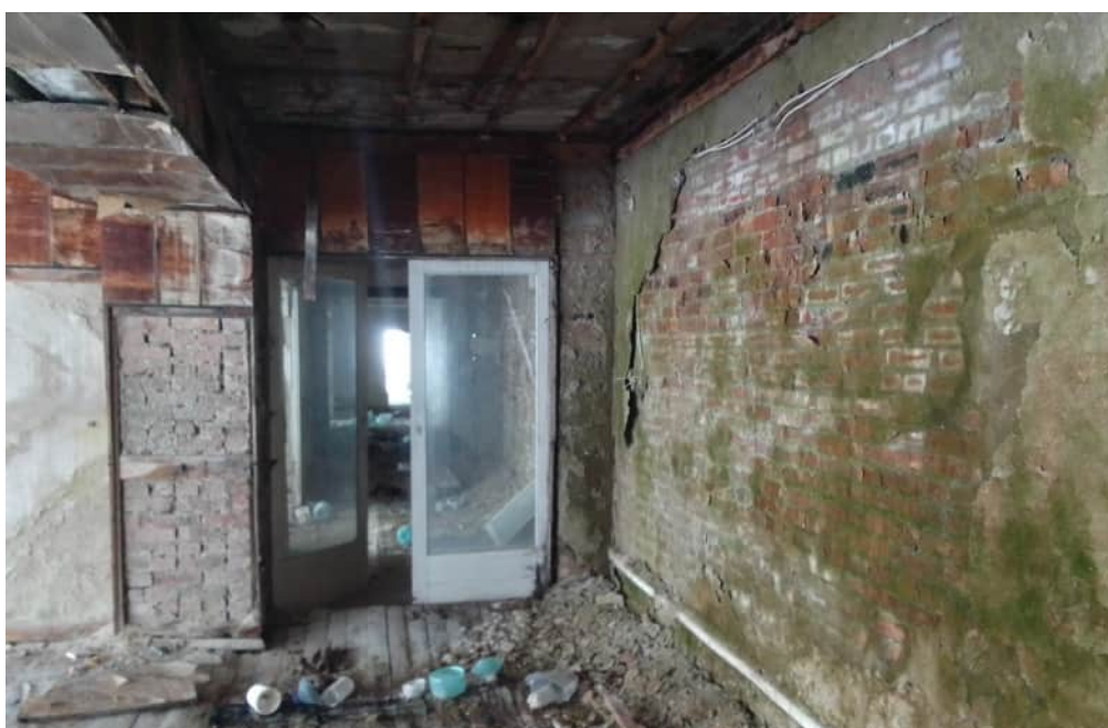
Фото 1.13 Разрушение штукатурного и покрасочного слоя стен